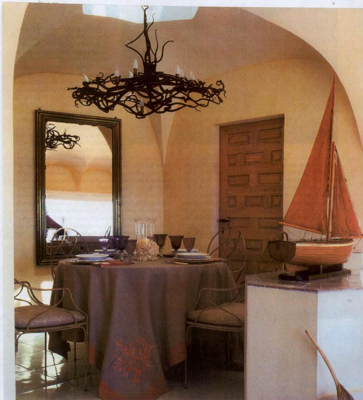
A SINISTRA: il soggiorno. Il divano in muratura ha cuscini realizzati su misura e rivestiti con tessuto di cotone grezzo e lino ricamato a mano di Mastro Raphaël. Oggetti etnici di Artestudio. SOPRA: la sala da pranzo interna è illuminata dal lucernario. Le poltroncine Covent Garden e lo specchio inizio '900 sono di Arcarosa. Il lampadario in ferro forgiato a mano è opera dell'artista belga Idir Mecibah, il modellino olandese di barca è del primo '900. Tovaglia in lino "Coralli" di Mastro Raphaël.