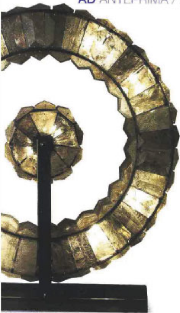
BRANDY & LUXURANCE Sovra: lampada da appoggio Doble con struttura in bronzo dorato e cristallo di rocca fianché. Di Mathieu Lasciere.