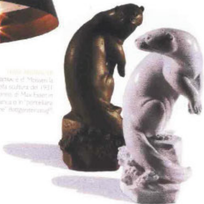
LEONARDI A destra: il "Mosca" la edizione della scultura del 1931 Lionel di Max Faer in porcellana bianca o in "porcellana rossa line" "Asgergerasud".

Oltre 8.500 metri quadrati al padiglione 7, 250 espositori. È lo spazio dedicato al design, alle proposte più innovative, per forme, funzioni e materiali. Ospita marchi leader e nomi emergenti, è la piattaforma di lancio per arredi e oggetti d'avanguardia.