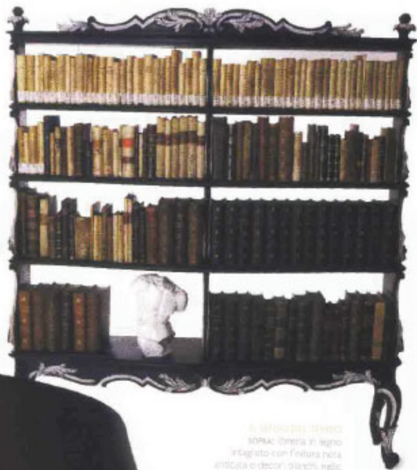
IL SENSO DEL TEMPO SOPALC libreria in legno intagliato con finitura nera antichità e decori bianchi, nelle storie del Settecento toscano. Veniva prodotta da Chelini.