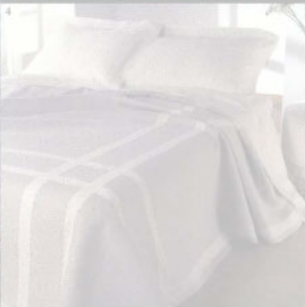
4. È IN LINO MEDIO PESO CON DECORAZIONI DI PIZZO SUL PIANO LETTO; IL COPRILETTO DANIELA, DI DEA, DISPONIBILE NELLE Tinte CLASSICHE O NELLE NUOVE Tinte ROSSE E BIANCO, COSTA 1.150 EURO.