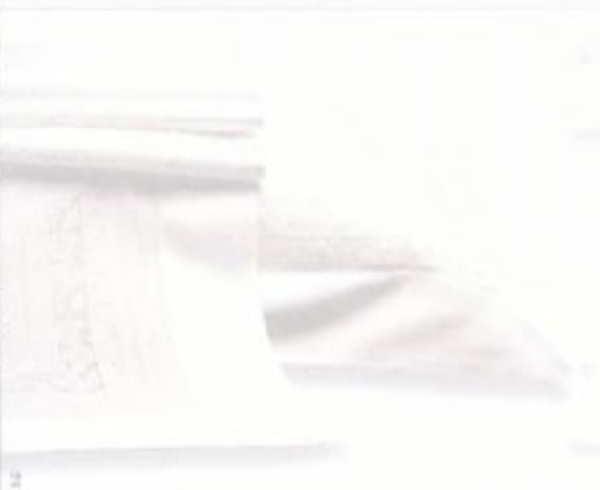
2-3. FANNO PARTE DELLA COLLEZIONE CLASS, IL TOP DELLA PRODUZIONE DEA, LE LINEE CHIARA (FOTO 2) E L'ARA (FOTO 3). LA PARURE MATRIMONIALE È IN VENDITA A PARTIRE DA 850 EURO.