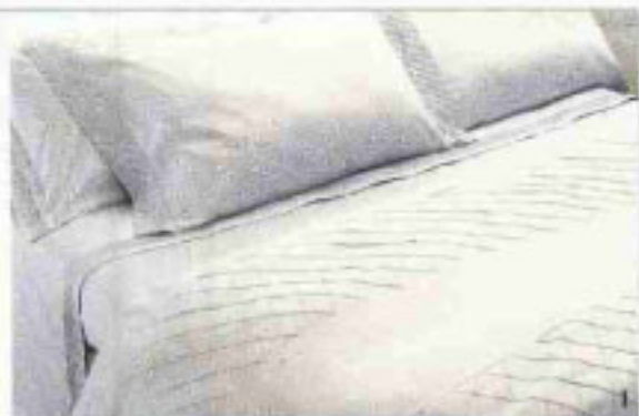
1. LE LINEE GEOMETRICHE DELLA COLLEZIONE BEAUX-ARTS RINNOVANO LE LENZUOLA IN PURISSIMO RASO DI MASTRO RAPHAEL. IL SET MATRIMONIALE COSTA 394 EURO.